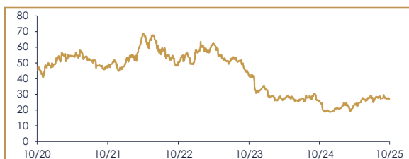
ANDAMENTO AZIONE AZIONI BAYER AG: ULTIMI 5 ANNI*